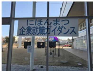
にほんまつ企業就職ガイダンス会場

説明を聞きに来てくれた生徒の皆さんの中に、将来マルナカで一緒に働く「未来の同僚」がいるかもしれません。そんな事を想像すると、とてもワクワクする時間でした。