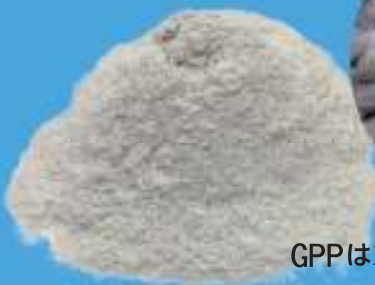
GPPは2013年9月特許出願済み