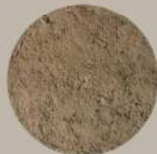
GPP攪拌直後良質土へ