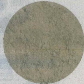
攪拌直後良質土へ