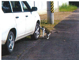
〔パトロール中のねこさん〕