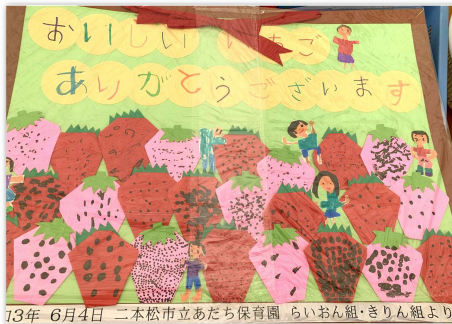
13年 6月4日 二本松市立あたち保育園 らいおん組・きりん組より

マルナカファームは5月末を以って、今シーズンの営業を終了しました。開園中は皆さんにご利用いただき、誠にありがとうございました。新しい苗を植える前に市内幼稚園児のみなさんに無料解放いたしました。(感染症対策を行った上、諸条件に賛同してくださった園のみご参加いただきました。)